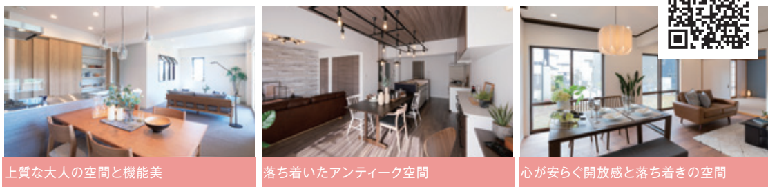
上質な大人の空間と機能美